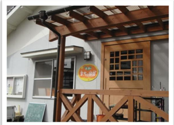
★「ニコニコキッチン」さんも活動しています♪